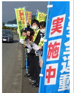
安全運転を呼びかけました