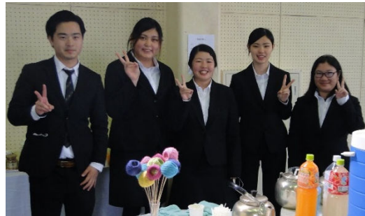
医療秘書学科1年生 お飲み物のサービスを担当