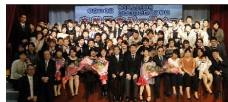
平成28年度集合写真