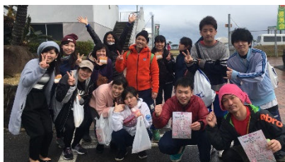
ボランティアやランナーとして参加した学生多数!