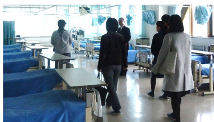
学校説明会・施設見学の様子