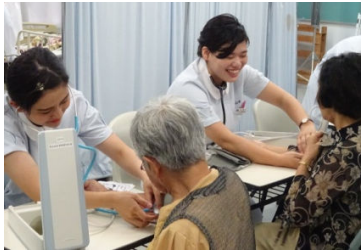
(看護学科) 血圧測定

九月八日（金）、小湊敬老感謝の集いが開かれました。私たち看護学科二年生は、地域の方々に訪問して招待状を配ったり、当日の送迎をしたり、血圧測定や出し物を担当しました。訪問時には、毎年楽しみにしている「よー」と言っていただけで、前日まで練習を頑張りました。当日はエイサーも大成功し、来者の方々の楽しんでいる様子も見る事ができました。