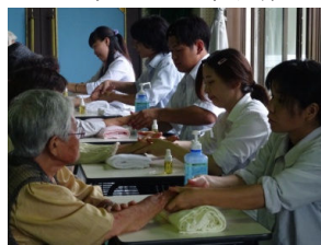
(こども・かいご福祉学科) ハンドマッサージ

お食事などを一緒に楽しみました。八月踊りや六調を全員で踊ったことがとても楽しく、印象に残りました。