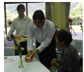
(医療秘書学科) 茶菓接待

来年も今回のように敬老者の方々に笑顔で楽しんでいただければ、各学科それぞれの役割を果たし頑張りたいです。