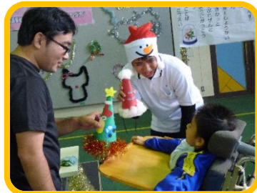
帽子のプレゼント☆