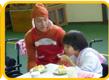
調理師養成学科の特製カレーとクリスマスケーキ♪