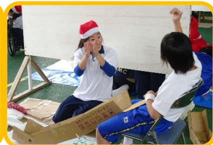
ダンスや手あそび、学生が作成したおもちゃで遊びました!