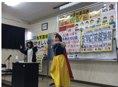
実演を交えた講義の様子

今回受講したことを活かして、これからも実習や講義に励み「おいしい」と言ってもらえるような調理師を目指し頑張りたいです。