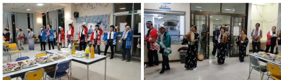
ハイビスカス寮の食堂で町内会の皆さんの輪に入って踊りました