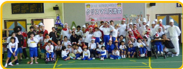
楽しい時間を過ごしました!

12月2日に行われた「大島養護学校小学部招待クリスマス交流会」に参加しました。養護学校の児童と交流するのは初めてだったので緊張しましたが、児童のみんなが予想以上に楽しく元気に遊んだり、一緒にダンスを踊ってくれたりしたので、自分自身も楽しむことができました。昼食のカレーとデザートクリスマスケーキも児童みんな喜んでくれたので良かったです。来年も楽しい交流会になるといいと思いました。