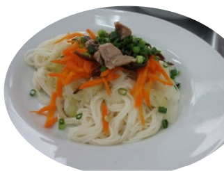
昼食の野菜そうめん

小湊敬老感謝の集いで、私たち調理師養成学科は昼食を担当し、野菜そうめんと赤飯、お土産にふくらかんを作りました。多人数の準備は大変でしたが、昼食中にお土産のふくらかんを配っている時、おじいちゃん、おばあちゃんたちから「そうめんおいしかったよ、ありがとう」と言われ、とても喜んでいただき嬉しかったです。調理師免許を取得し、就職した時に「おいしかった」と喜んでもらえるような料理を提供できる調理師になりたいです。