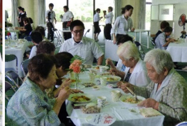
敬老者の皆様と一緒に昼食