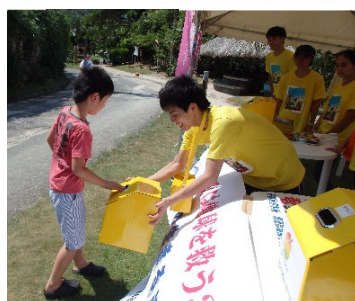
大浜海浜公園会場