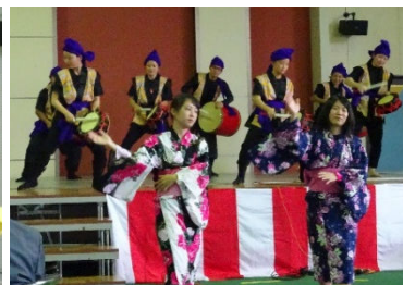
敬老者の皆様と一緒に昼食