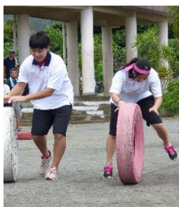
各種目、楽しく参加しました

9月11日に小湊小学校の運動会に参加しました。専門学校チームとして、こども・かいご福祉学科の1年生と医療秘書学科の1・2年生の合同チームで出場しましたが、素晴らしいチームワークで同率3位になることができました。途中、雨が降ったりしましたが、そのような天気にも負けないくらいの小湊地区の皆さんの活気でした。来年こそは、優勝目指して頑張っていきたいです。