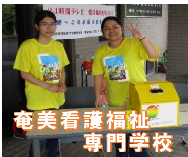
奄美看護福祉専門学校