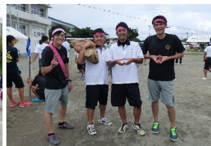
チームワークも発揮！！