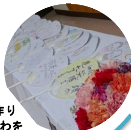
手作りうちわをプレゼント☆