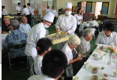
真心をこめて作りました