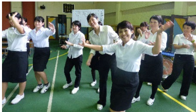
最後は八月踊りと六調♪